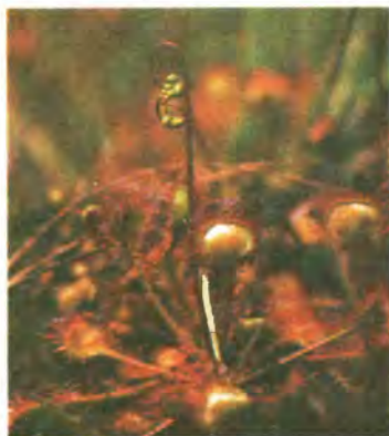
323. Вовче тіло болотне.